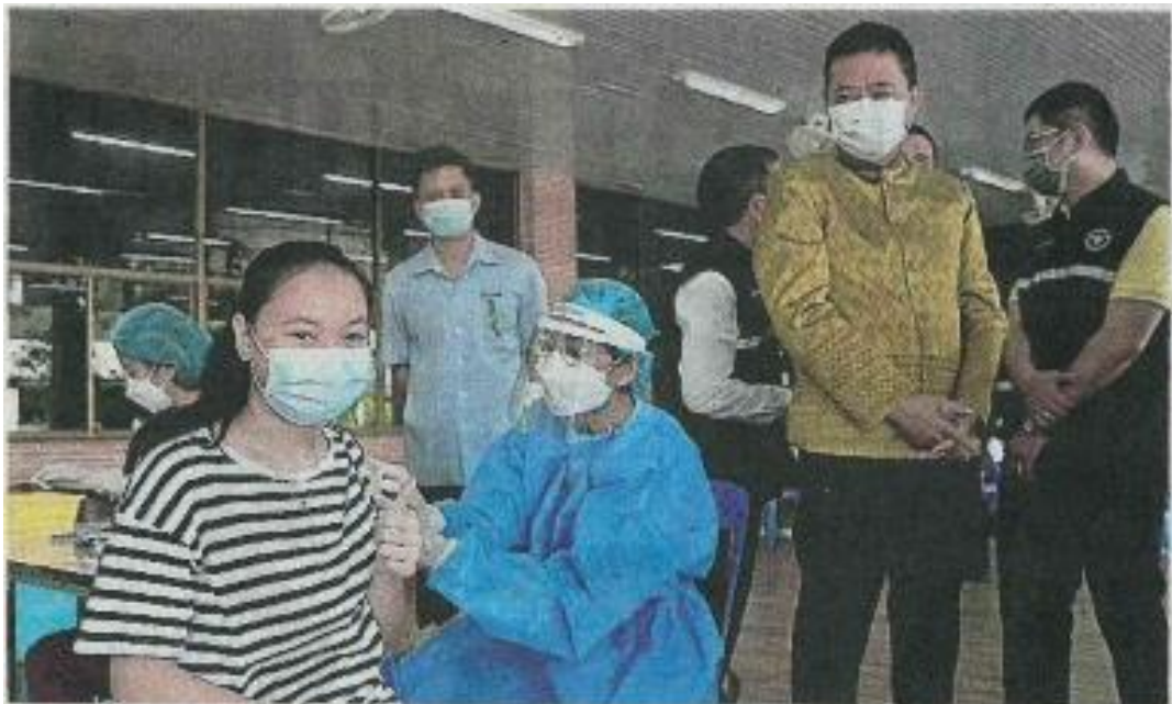
ทั้งตรวจทั้งฉีด นายวีระชัย นาคมาศ ผวจ.พระนครศรีอยุธยา ตรวจเชิงรุก โควิด-19 ค้นหาต้นตอการติดเชื้อ โควิด และฉีดวัคซีนให้กับประชาชน ที่วัดใหญ่ชัยมงคล จ.พระนครศรีอยุธยา.

ข่าวประจำวันจันทร์ที่ 24 พฤศจิกายน 2564 หน้า 20