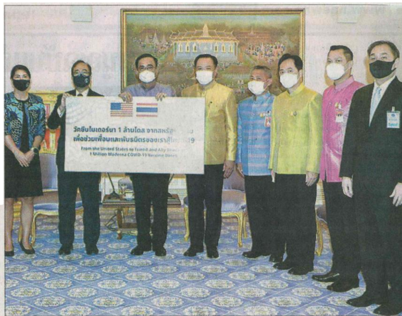
➢ รับมอบวัคซีน : พลเอกประยุทธ์ จันทร์โอชา นายกรัฐมนตรี และ รมว. กลาโหม พร้อมคณะ รับมอบวัคซีนป้องกันโควิด-19 ของบริษัท Moderna (โมเดอร์นา) จากรัฐบาลสหรัฐฯ จำนวน 1 ล้านโดส จากนายไมเคิล ซิดู อุปทูตรักษาราชการชั่วคราว สถานเอกอัครราชทูตสหรัฐอเมริกา ประจำประเทศไทย ที่ทำเนียบรัฐบาล

ข่าวประจำวันจันทร์ที่ 24 พฤศจิกายน 2564 หน้า 1