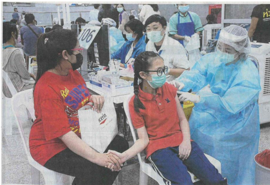
▲ ไฟเซอร์เข็ม 1 เด็กนักเรียนหญิง รายนี้จับมือผู้ปกครองแน่น ระหว่างการฉีดวัคซีนไฟเซอร์ เข็มที่ 1 สำหรับเด็กอายุ 12-18 ปี ที่ศูนย์ฉีดวัคซีนกลางบางซื่อ มีเงื่อนไขเป็นเด็กนักเรียนที่ศึกษาจากระบบ หรือเด็กที่ยังไม่เคยได้รับวัคซีน จากจุดฉีดในสถานศึกษาใดมาก่อน และต้องได้รับการยินยอมจากผู้ปกครอง เปิดวอลีก่อนที่ประตู 1 จนถึงวันที่ 7 ธ.ค.นี้

ข่าวประจำวันจันทร์ที่ 24 พฤศจิกายน 2564 หน้า 1